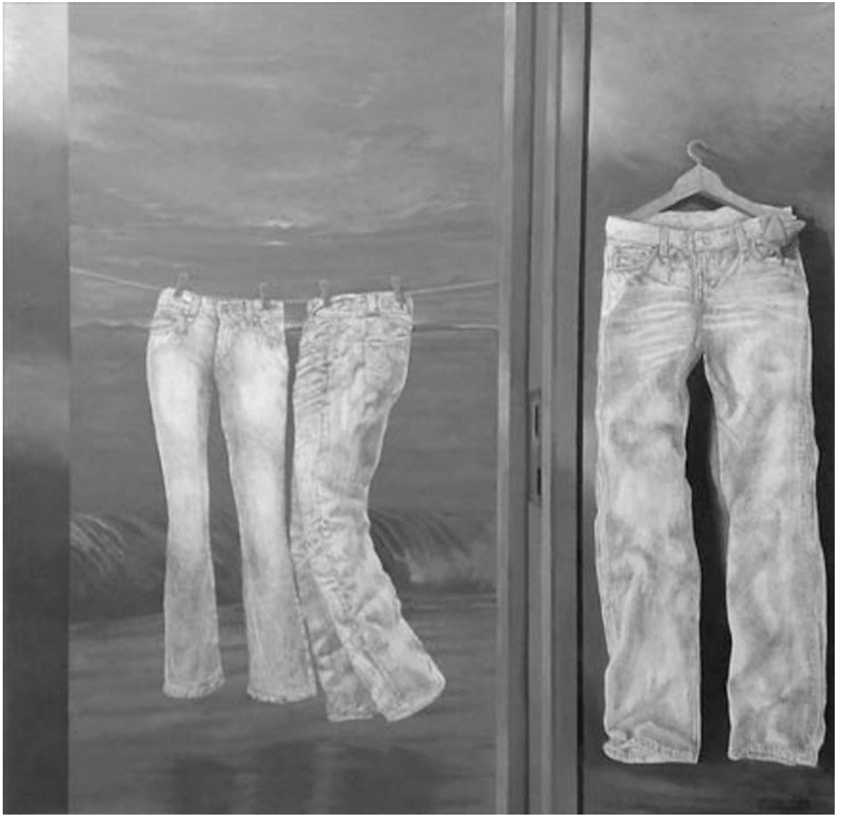
حُزن | زيت على قماش 150/115 عصام درويش، فنان سوري